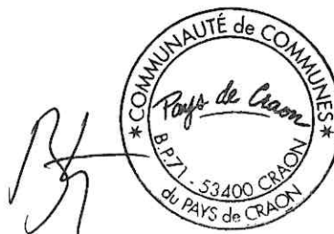
Bertrand de GUÉBRIANT

Accusé de réception - Ministère de l'Intérieur