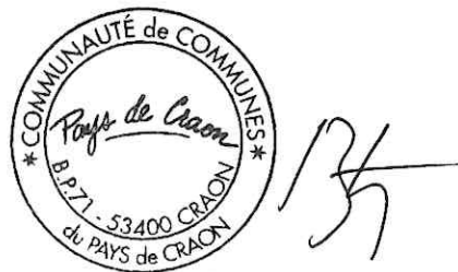
Bertrand de GUÉBRIANT

Accusé de réception - Ministère de l'Intérieur