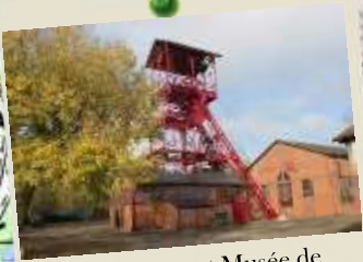
Chevalement Musée de l'Ardoise et de la Géologie