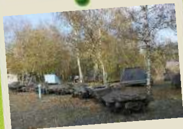
La butte des fendeurs sur le site de Lonchamps.