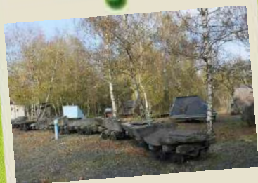
La butte des fendeurs sur le site de Lonchamps.