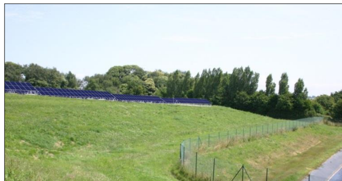
Figure 3 : Photomontage de la future centrale solaire photovoltaïque au sol de l'ancien CET de Livré-la-Touche

La puissance maximale installée sera de 5,73 MW. La centrale permettra ainsi la production annuelle de plus de 6,3 millions de kWh, soit l'équivalent de la consommation annuelle électrique (chauffage inclus) d'environ 1800 personnes.