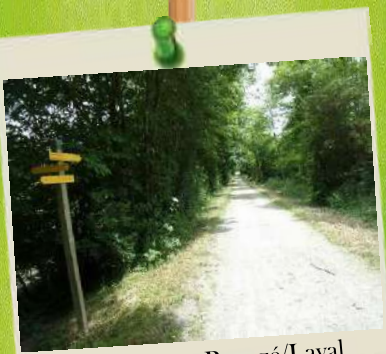
Voie Verte Renazé/Laval